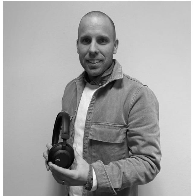
Jays Q-seven bäst i test i Aftonbladets stora test av hörlurar med aktiv brusreducering