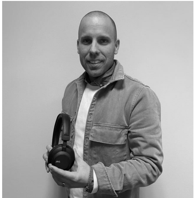
Jays Q-seven bäst i test i Aftonbladets stora test av hörlurar med aktiv brusreducering